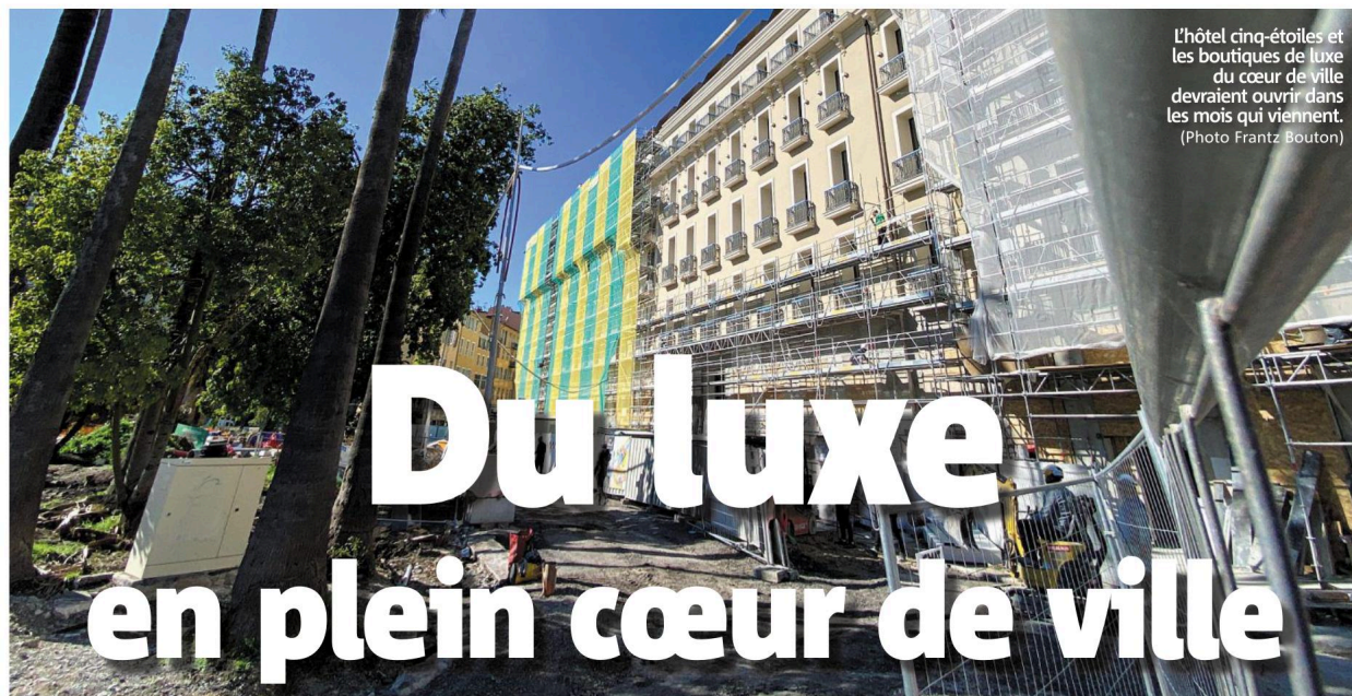
L'hôtel cinq-étoiles et les boutiques de luxe du cœur de ville devraient ouvrir dans les mois qui viennent.